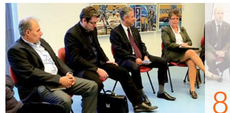
Nemak: Sportcentrum az iskolának