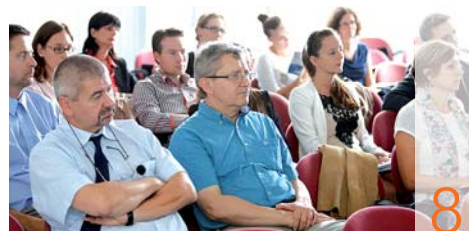
Wolf: Megújult üzlet Adyvárosban