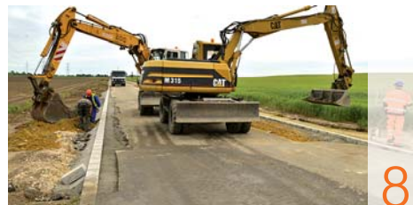
Ipari Park: infrastruktúra-fejlesztés