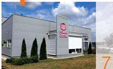
N-Fólia: minőséggel a vevőkért