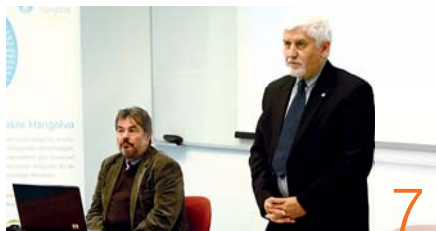
Jankovits Hidraulika: munkavédelem