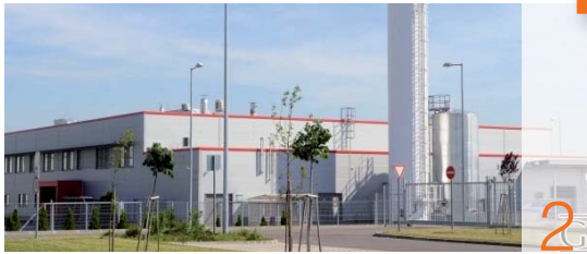
Kiváló esztendő piacbővüléssel