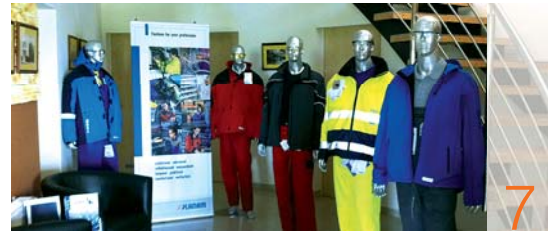
Egyedi igényekre koncentrálnak