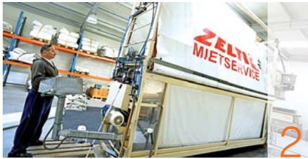
Sikeres profilváltás és bővítés